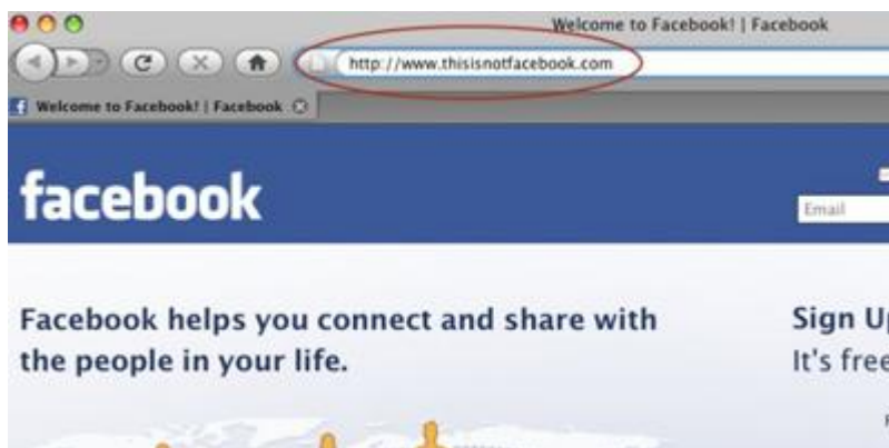
Εικόνα 1: Απομίμηση της σελίδας του Facebook

Μία από τις "πονηρές" προσπάθειες υποκλοπής των στοιχείων μας είναι το "στήσιμο" μιας απομίμησης του πραγματικού site που θέλουμε να επισκεφθούμε. Αυτός μπορεί να είναι ένας ιστότοπος κοινωνικής δικτύωσης ή ακόμα και μια ιστοσελίδα τραπεζικού οργανισμού. Αν κάνουμε το λάθος και παραχωρήσουμε τους κωδικούς μας σε μια τέτοια περίπτωση, τότε οι επιτήδριοι που ελέγχουν αυτά τα υποτιθέμενα site θα το εκμεταλλευτούν ανάλογα.