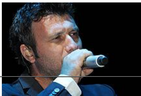
Live στην Αγία Γαλήνη, Κρήτη 2013

Το 2010 κυκλοφόρησε το album "Προσωπικά Δεδομένα" με 17 καινούργια τραγούδια συν τα κομμάτια "Το φωνάζω" και "Θησαυρός" τα οποία είχαν κυκλοφορήσει νωρίτερα μεσω του διαδικτυου.Το συγκεκριμένο album έγινε επτά φορές πλατινένιο.Ο Γιάννης Πλούταρχος ξεκίνησε και πάλι τις νυχτερινές του εμφανίσεις για την άνοιξη του 2010 σε χώρο στην Ιερά Οδό με την ονομασία "Acro" στις 8/4/10.