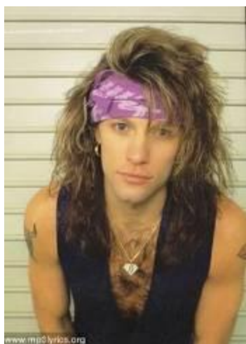
Jon Bongiovi (1983-)

Οι Μπον Τζοβι δημιουργήθηκαν το 1983 στο New Jersey. Τα μέλη είναι οι: Jon Bongiovi (lead singer-songwriter), Richie Sambora (guitarist), Alec John Such ο οποίος εγκατέλειψε αλλά αντικαταστάθηκε από τον Hugh McDonald το 1994 (και οι δύο bassists). Επίσης ο Tico Torres είναι drummer και ο David Bryan keyboardist. Ο David και ο John ήταν μαζί από τα 16 τους καθώς έπαιζαν σε μια μπάντα, την "Atlantic City". Ο David εγκατέλειψε για να σπουδάσει φαρμακευτική, αλλά αργότερα, όταν ο John τον κάλεσε λέγοντάς του πως ετοιμάζει καινούρια μπάντα και πως η επιτυχία ήταν πολύ πιθανή, ο David εγκατέλειψε τις σπουδές του.