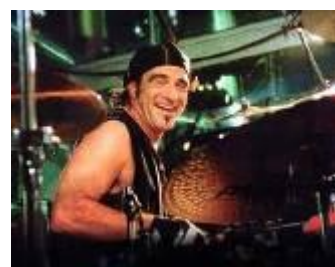
Tico Torres (1983-)

Όταν τα μέλη είχαν συγκεντρωθεί, έπρεπε να βρουν όνομα. Οι παραγωγοί τους πρότειναν το "Bon Jovi", που είναι το επίθετο του τραγουδιστή-τραγουδοποιού και ιδρυτικού μέλος του συγκροτήματος ακολουθώντας το παράδειγμα των Van Halen όπου το Van Halen είναι το επίθετο των δυο αδερφών και ιδρυτικών μελών του συγκροτήματος αυτού. Το όνομα δεν ενθουσίασε ιδιαίτερα, παρόλα αυτά, δύο χρόνια μετά ανέβηκαν ψηλά στα charts με αυτό το όνομα. Ο ντράμερ ήταν αρκετά έμπειρος αφού είχε ηχογραφήσει και παίξει live με το "Φάντασμα της όπερας".