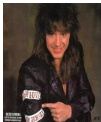
Richie Sambora (1983-2013)